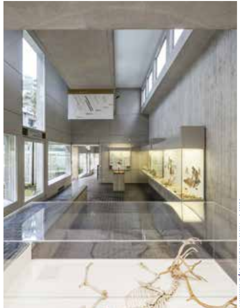
Salle 3