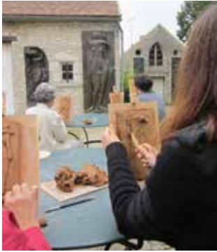
Atelier modelage