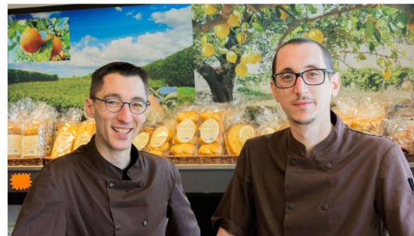
Nouvel OBS - Face à la fermeture des marchés, primeurs, bouchers, et fromagers se mettent à la vente en ligne.