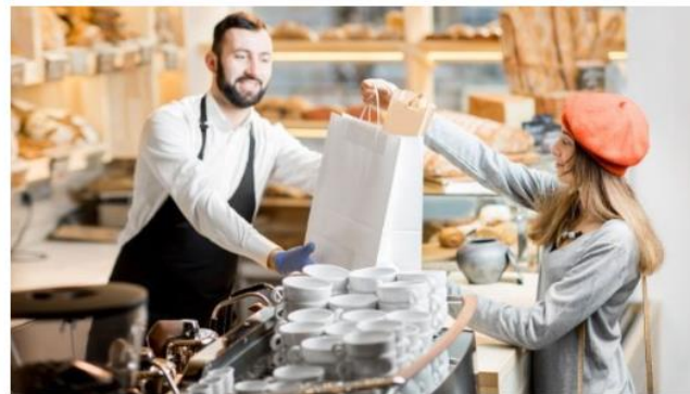
Avec le coronavirus, le click-and-collect en forte hausse chez les commerçants de proximité

Plus de 1 000 boutiques actives déjà référencées