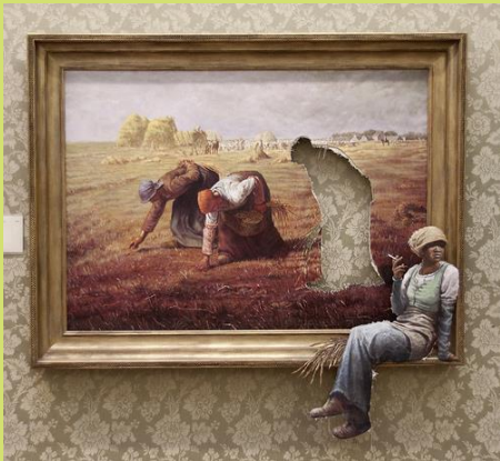
Les glaneuses Banksy 2008 Bristol City Museum