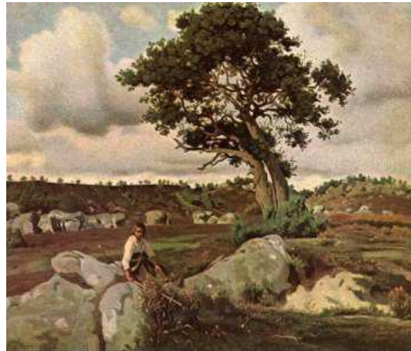
Forêt de Fontainebleau , Camille COROT (1796-1875), huile sur toile, 1830