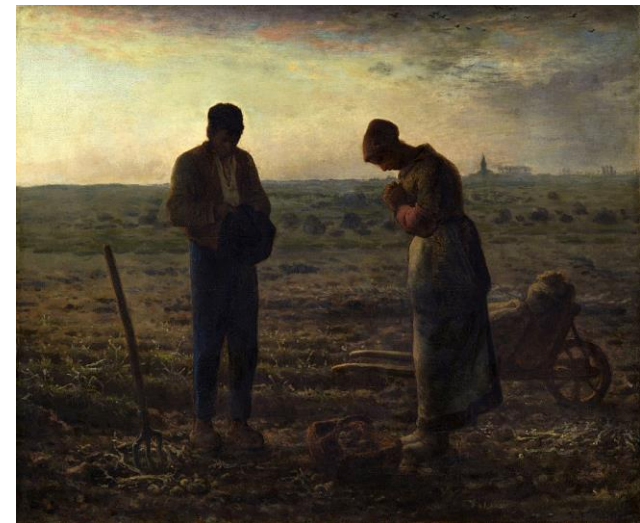
L'Angélus , Jean-François Millet, huile sur toile, 1857-1859.

« Ce n'est ni la campagne, ni Paris, ni Montmartre, ni la Côte d'azur, mais un peu de tout cela dans un mélange auquel s'ajoute la poésie de la forêt » André Billy, Les Beaux Jours de Barbizon , 1947.