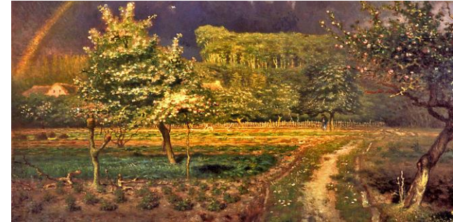
Printemps à Barbizon , Jean-François Millet 1873